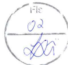
MÁRIO SERGIO TASSINARI Prefeito Municipal